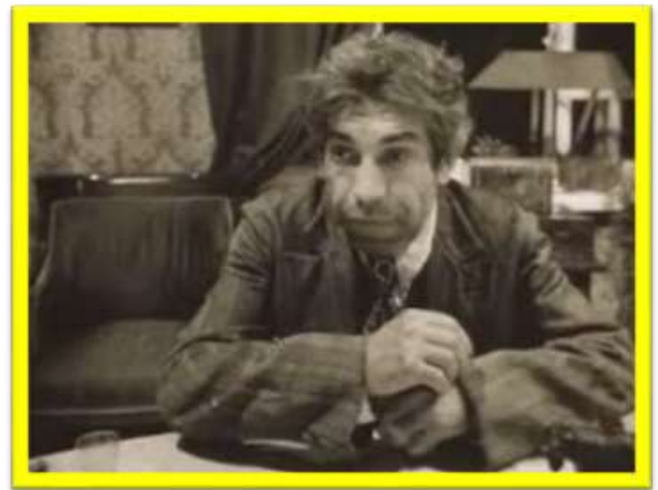
«исключительный прохвост», «хам и свинья», «дикарь»