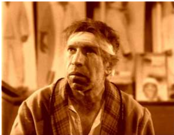
«Весь ужас в том, что у него уже не собачье, а именно человеческое сердце»